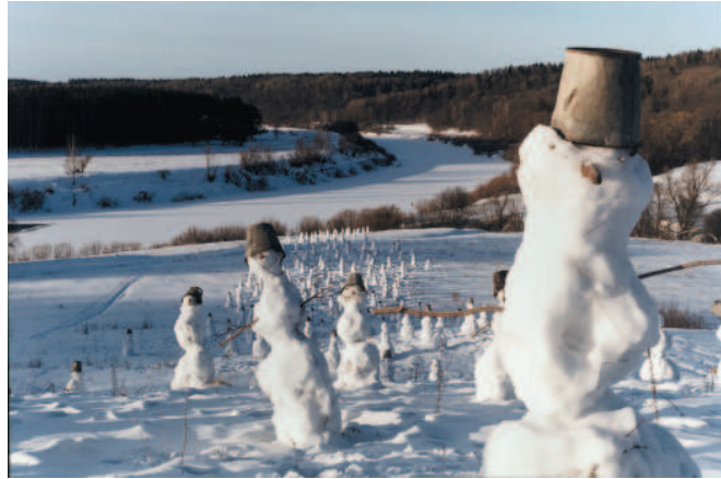
Bashnia - Tour, 2001